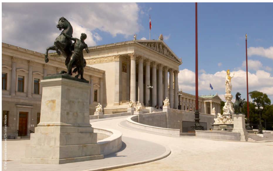
Parlament beschloss Gesetz zur Sanierung des Budgets